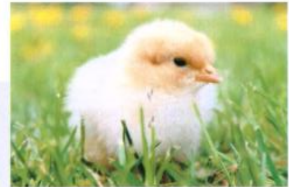
Bruderhahn-Projekt und Zweinutzungshuhn

Wir sollten Tiere mit Liebe behandeln und ihr Leid lindern, wo immer wir können. Dalai Lama